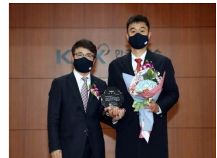
▶ 유가증권시장 공시우수법인 표창 시상식 기념 사진