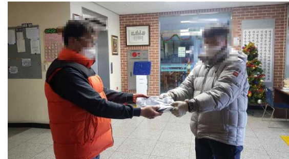
▶ 지원 받은 물품 수령 및 전달 모습