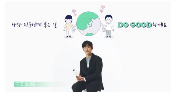
▶ 'DO GOOD' Project 영상 화면(일부)