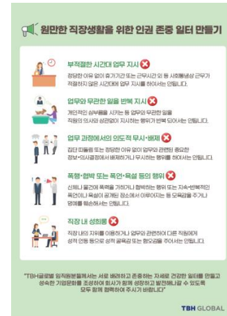
▶ 인권존중 일터 만들기 캠페인 포스터

(주)티비에이치글로벌은 모든 근로자의 인권을 존중하며 보장받을 수 있도록 <인권 존중 일터 만들기> 캠페인을 진행하여 부적절하고 비효율적인 업무 지시나 본연의 업무와 무관한 일의 반복 지시, 또는 직장 내 괴롭힘에 해당되는 상황이 발생 시 이에 대한 문제 제기를 적극적으로 할 수 있도록 소통의 창구를 마련하였습니다. 이와 같이 개인의 인격과 권리를 존중 받지 못하는 직장 생활에서의 어려움이 확인되는 경우, 회사는 이에 대해 빠르게 대처하여 전 임직원 모두가 더욱 서로 배려하고 존중하는 인권적인 일터가 될 수 있도록 앞으로도 최선을 다할 것입니다.