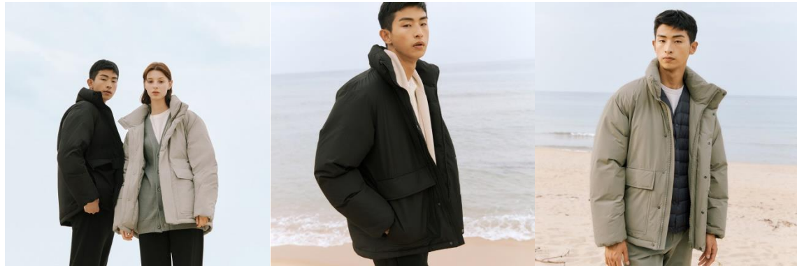
▶ 베이직하우스 RDS 솜다운 점퍼