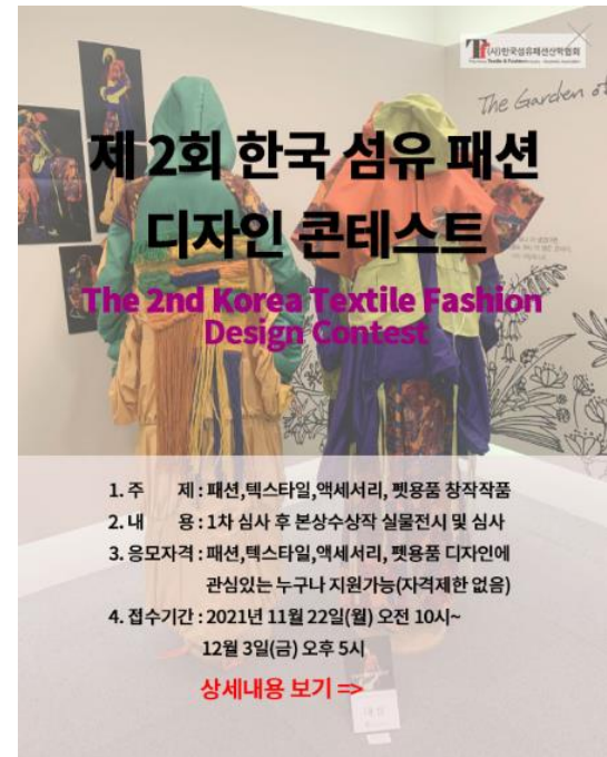
▶ 제2회 한국 섬유패션 디자인 콘테스트 홈페이지 공고문

(사)한국섬유패션산학협회는 이번 콘테스트를 통하여 패션·텍스타일·액세서리·펫용품 디자인 분야의 창의적인 글로벌 인재를 발굴하고, 국내외 패션·텍스타일·액세서리·펫용품의 부가가치 창출과 더불어 세계적 브랜드화를 통한 섬유·패션 산업의 진흥을 추구하고자 합니다. 꿈과 희망을 품은 많은 인재들의 참여를 기대하며, 이를 통하여 (주)티비에이치글로벌 또한 한국 패션 산업의 발전을 위해 함께 할 것입니다.