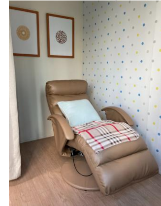
▶ 여직원 휴게실 - 신규 리클라이너 교체

모든 여직원의 모성을 보호하고 그 능력을 직장 생활에서도 최대한 발휘할 수 있도록 마련된 여직원 휴게실(Women's Lounge)은 현재까지 많은 여직원들의 쉼과 치유의 장소로 활용되고 있으며, 특히 출산 휴가 후 복직한 여직원들에게는 없어서는 안 될 소중한 공간으로 자리매김하였습니다. 2014년에 처음 조성되어 8년 차에 접어든 올해에는 몇 가지 낡고 소진되어진 물품들을 새로 구비하여 교체하는 등 좀 더 안락한 환경을 조성하고자 하였습니다. 여직원들만을 위한 유의미한 공간으로 유지되고 있는 여직원 휴게실이 앞으로도 더욱 안전하고 유용하게 활용되어질 수 있기를 기대합니다.