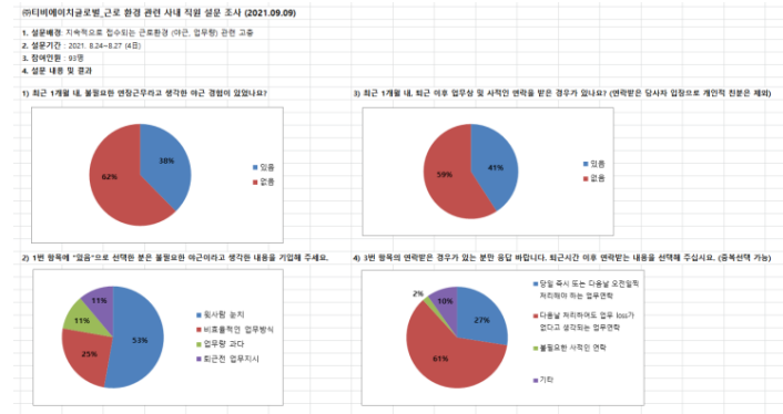
▶ 고충처리 위원회 _근로자 설문 결과

최근 회사는 점점 더 다양한 세대가 공존하여 운영되어지고 있으며, 함께 소통하고 협업해야 하는 과정은 더욱 중요해졌습니다. 모든 근로자들은 공동체 의식을 가지고 상호 이해하고 존중하며 배려하는 근무 환경을 조성하도록 노력할 것이며, 회사 또한 이를 적극 지지하여 더욱 성장하고 발전해 나아갈 수 있는 기틀을 마련하는 데 최선을 다하고자 합니다.